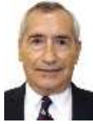
DIP. RAÚL EDUARDO BONIFAZ MOEDANO