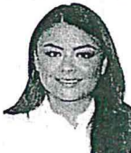
Sen. Sasil De León Villard