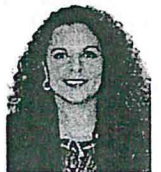
Sen. Rocío Adriana Abreu Artiñano