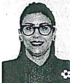
Sen. Vanessa Rubio Márquez