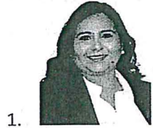
1. Sen. Mayuli Latifa Martínez Simón Presidenta