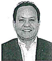
3. Sen. Clemente Castañeda Hoeflich Secretario