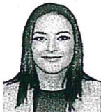
Sen. Martha Cecilia Márquez Alvarado