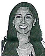
Sen. Freyda Marybel Villegas Canché