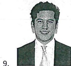
Sen. Rogelio Israel Zamora Guzmán