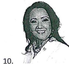
Sen. Cora Cecilia Pinedo Alonso