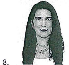
Sen. Kenia López Rabadán