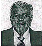
Sen. José Narro Céspedes