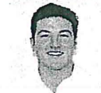
Sen. Samuel Alejandro García Sepúlveda