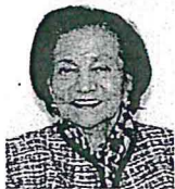
Sen. Ifigenia Martínez Hernández