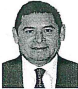
Sen. Alejandro Armenta Mier PRESIDENTE