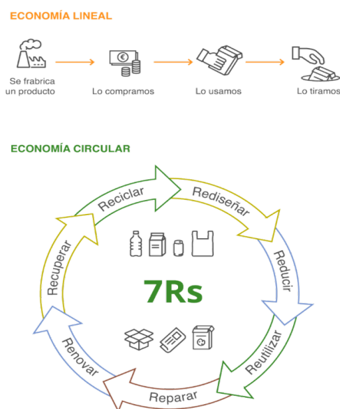
Figura 3: Modelo de economía lineal y economía circular 14 .

El objetivo del modelo de economía circular es aprovechar al máximo los recursos disponibles al mismo tiempo que se preserva y disminuyen los impactos al medio ambiente. Este modelo también aboga por la optimización de los materiales y residuos, alargando su vida útil. Para lograr lo anterior, la economía circular hace uso de las 7Rs. Las 7Rs implican que, los productos, sean diseñados para ser reutilizados. En contraposición al modelo de producción actual la economía circular junto con las 7Rs y el ecodiseño considera la variable ambiental como un criterio más a la hora de tomar decisiones en el proceso de diseño de los productos 13 .