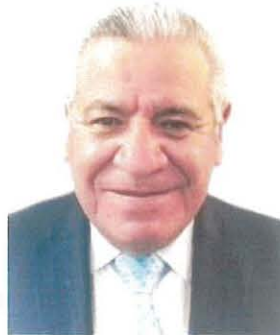
Sen. José Alfredo Botello Montes

REGISTRO DE LA VOTACIÓN DEL DICTAMEN DE LA TERCERA COMISIÓN CON PUNTO DE ACUERDO POR EL QUE LA COMISIÓN PERMANENTE DEL HONORABLE CONGRESO DE LA UNIÓN, EXHORTA RESPETUOSAMENTE A LA COMISIÓN NACIONAL DEL AGUA, PARA QUE, EN EL ÁMBITO DE SUS RESPECTIVAS COMPETENCIAS Y ATRIBUCIONES, ANALICE LA VIABILIDAD DE INCORPORAR EN EL PROYECTO DE PRESUPUESTO DE EGRESOS DE LA FEDERACIÓN PARA EL EJERCICIO FISCAL DEL AÑO 2023, RECURSOS DESTINADOS A LAS OBRAS DE INFRAESTRUCTURA HIDRÁULICA EN LA COMARCA LAGUNERA, PARTICULARMENTE ATENDIENDO EL PROYECTO DE PRESA TUNAL II.