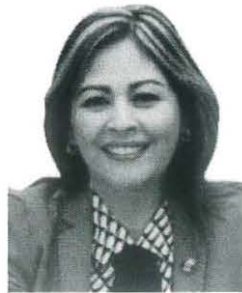
Sen. Lucía Virginia Meza Guzmán

REGISTRO DE LA VOTACIÓN DEL DICTAMEN DE LA TERCERA COMISIÓN CON PUNTO DE ACUERDO POR EL QUE LA COMISIÓN PERMANENTE DEL HONORABLE CONGRESO DE LA UNIÓN, EXHORTA RESPECTUOSAMENTE A LA COMISIÓN NACIONAL DEL AGUA, PARA QUE, EN EL ÁMBITO DE SUS RESPECTIVAS COMPETENCIAS Y ATRIBUCIONES, ANALICE LA VIABILIDAD DE INCORPORAR EN EL PROYECTO DE PRESUPUESTO DE EGRESOS DE LA FEDERACIÓN PARA EL EJERCICIO FISCAL DEL AÑO 2023, RECURSOS DESTINADOS A LAS OBRAS DE INFRAESTRUCTURA HIDRÁULICA EN LA COMARCA LAGUNERA, PARTICULARMENTE ATENDIENDO EL PROYECTO DE PRESA TUNAL II.