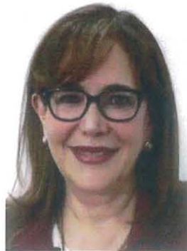
Dip. Yeidckol Polevnsky Gurwitz

REGISTRO DE LA VOTACIÓN DEL DICTAMEN DE LA TERCERA COMISIÓN CON PUNTO DE ACUERDO POR EL QUE LA COMISIÓN PERMANENTE DEL HONORABLE CONGRESO DE LA UNIÓN, EXHORTA RESPETUOSAMENTE A LA COMISIÓN NACIONAL DEL AGUA, PARA QUE, EN EL ÁMBITO DE SUS RESPECTIVAS COMPETENCIAS Y ATRIBUCIONES, ANALICE LA VIABILIDAD DE INCORPORAR EN EL PROYECTO DE PRESUPUESTO DE EGRESOS DE LA FEDERACIÓN PARA EL EJERCICIO FISCAL DEL AÑO 2023, RECURSOS DESTINADOS A LAS OBRAS DE INFRAESTRUCTURA HIDRÁULICA EN LA COMARCA LAGUNERA, PARTICULARMENTE ATENDIENDO EL PROYECTO DE PRESA TUNAL II.