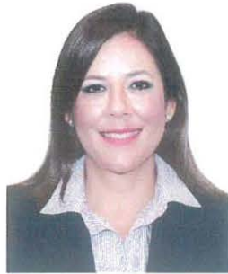
Sen. Gina Andrea Cruz Blackledge

REGISTRO DE LA VOTACIÓN DEL DICTAMEN DE LA TERCERA COMISIÓN CON PUNTO DE ACUERDO POR EL QUE LA COMISIÓN PERMANENTE DEL HONORABLE CONGRESO DE LA UNIÓN, EXHORTA RESPETUOSAMENTE A LA COMISIÓN NACIONAL DEL AGUA, PARA QUE, EN EL ÁMBITO DE SUS RESPECTIVAS COMPETENCIAS Y ATRIBUCIONES, ANALICE LA VIABILIDAD DE INCORPORAR EN EL PROYECTO DE PRESUPUESTO DE EGRESOS DE LA FEDERACIÓN PARA EL EJERCICIO FISCAL DEL AÑO 2023, RECURSOS DESTINADOS A LAS OBRAS DE INFRAESTRUCTURA HIDRÁULICA EN LA COMARCA LAGUNERA, PARTICULARMENTE ATENDIENDO EL PROYECTO DE PRESA TUNAL II.