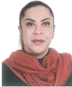
Sen. Eunice Renata Romo Molina

REGISTRO DE LA VOTACIÓN DEL DICTAMEN DE LA TERCERA COMISIÓN CON PUNTO DE ACUERDO POR EL QUE LA COMISIÓN PERMANENTE DEL HONORABLE CONGRESO DE LA UNIÓN, EXHORTA RESPETUOSAMENTE A LA COMISIÓN NACIONAL DEL AGUA, PARA QUE, EN EL ÁMBITO DE SUS RESPECTIVAS COMPETENCIAS Y ATRIBUCIONES, ANALICE LA VIABILIDAD DE INCORPORAR EN EL PROYECTO DE PRESUPUESTO DE EGRESOS DE LA FEDERACIÓN PARA EL EJERCICIO FISCAL DEL AÑO 2023, RECURSOS DESTINADOS A LAS OBRAS DE INFRAESTRUCTURA HIDRÁULICA EN LA COMARCA LAGUNERA, PARTICULARMENTE ATENDIENDO EL PROYECTO DE PRESA TUNAL II.