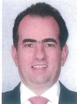
Dip. José Francisco Yunes Zorrilla

REGISTRO DE LA VOTACIÓN DEL DICTAMEN DE LA TERCERA COMISIÓN CON PUNTO DE ACUERDO POR EL QUE LA COMISIÓN PERMANENTE DEL HONORABLE CONGRESO DE LA UNIÓN, EXHORTA RESPETUOSAMENTE A LA COMISIÓN NACIONAL DEL AGUA, PARA QUE, EN EL ÁMBITO DE SUS RESPECTIVAS COMPETENCIAS Y ATRIBUCIONES, ANALICE LA VIABILIDAD DE INCORPORAR EN EL PROYECTO DE PRESUPUESTO DE EGRESOS DE LA FEDERACIÓN PARA EL EJERCICIO FISCAL DEL AÑO 2023, RECURSOS DESTINADOS A LAS OBRAS DE INFRAESTRUCTURA HIDRÁULICA EN LA COMARCA LAGUNERA, PARTICULARMENTE ATENDIENDO EL PROYECTO DE PRESA TUNAL II.