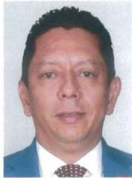
Dip. Jorge Luis Llaven Abarca

REGISTRO DE LA VOTACIÓN DEL DICTAMEN DE LA TERCERA COMISIÓN CON PUNTO DE ACUERDO POR EL QUE LA COMISIÓN PERMANENTE DEL HONORABLE CONGRESO DE LA UNIÓN, EXHORTA RESPETUOSAMENTE A LA COMISIÓN NACIONAL DEL AGUA, PARA QUE, EN EL ÁMBITO DE SUS RESPECTIVAS COMPETENCIAS Y ATRIBUCIONES, ANALICE LA VIABILIDAD DE INCORPORAR EN EL PROYECTO DE PRESUPUESTO DE EGRESOS DE LA FEDERACIÓN PARA EL EJERCICIO FISCAL DEL AÑO 2023, RECURSOS DESTINADOS A LAS OBRAS DE INFRAESTRUCTURA HIDRÁULICA EN LA COMARCA LAGUNERA, PARTICULARMENTE ATENDIENDO EL PROYECTO DE PRESA TUNAL II.