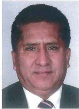
Dip. Raymundo Atanacio Luna

REGISTRO DE LA VOTACIÓN DEL DICTAMEN DE LA TERCERA COMISIÓN CON PUNTO DE ACUERDO POR EL QUE LA COMISIÓN PERMANENTE DEL HONORABLE CONGRESO DE LA UNIÓN, EXHORTA RESPETUOSAMENTE A LA COMISIÓN NACIONAL DEL AGUA, PARA QUE, EN EL ÁMBITO DE SUS RESPECTIVAS COMPETENCIAS Y ATRIBUCIONES, ANALICE LA VIABILIDAD DE INCORPORAR EN EL PROYECTO DE PRESUPUESTO DE EGRESOS DE LA FEDERACIÓN PARA EL EJERCICIO FISCAL DEL AÑO 2023, RECURSOS DESTINADOS A LAS OBRAS DE INFRAESTRUCTURA HIDRÁULICA EN LA COMARCA LAGUNERA, PARTICULARMENTE ATENDIENDO EL PROYECTO DE PRESA TUNAL II.