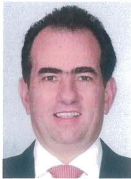
Dip. José Francisco Yunes Zorrilla

REGISTRO DE LA VOTACIÓN DEL DICTAMEN DE LA TERCERA COMISIÓN CON PUNTO DE ACUERDO POR EL QUE LA COMISIÓN PERMANENTE DEL HONORABLE CONGRESO DE LA UNIÓN EXHORTA RESPECTUOSAMENTE A LA SECRETARÍA DE GOBERNACIÓN, PARA QUE, A TRAVÉS DE LA COMISIÓN NACIONAL PARA PREVENIR Y ERRADICAR LA VIOLENCIA CONTRA LAS MUJERES, CONTINÚE CON LA VIGILANCIA Y MINISTRACIÓN EN TIEMPO Y FORMA DE LOS RECURSOS ETIQUETADOS EN EL PROGRAMA DE APOYO PARA REFUGIOS ESPECIALIZADOS PARA MUJERES VÍCTIMAS DE VIOLENCIA DE GÉNERO, SUS HIJAS E HIJOS, DEL EJERCICIO FISCAL 2022.