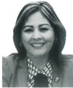
Sen. Lucía Virginia Meza Guzmán

REGISTRO DE LA VOTACIÓN DEL DICTAMEN DE LA TERCERA COMISIÓN CON PUNTO DE ACUERDO POR EL QUE LA COMISIÓN PERMANENTE DEL HONORABLE CONGRESO DE LA UNIÓN EXHORTA RESPECTUOSAMENTE A LA SECRETARÍA DE GOBERNACIÓN, PARA QUE, A TRAVÉS DE LA COMISIÓN NACIONAL PARA PREVENIR Y ERRADICAR LA VIOLENCIA CONTRA LAS MUJERES, CONTINÚE CON LA VIGILANCIA Y MINISTRACIÓN EN TIEMPO Y FORMA DE LOS RECURSOS ETIQUETADOS EN EL PROGRAMA DE APOYO PARA REFUGIOS ESPECIALIZADOS PARA MUJERES VÍCTIMAS DE VIOLENCIA DE GÉNERO, SUS HIJAS E HIJOS, DEL EJERCICIO FISCAL 2022.