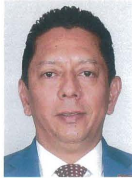
Dip. Jorge Luis Llaven Abarca

REGISTRO DE LA VOTACIÓN DEL DICTAMEN DE LA TERCERA COMISIÓN CON PUNTO DE ACUERDO POR EL QUE LA COMISIÓN PERMANENTE DEL HONORABLE CONGRESO DE LA UNIÓN EXHORTA RESPETUOSAMENTE A LA SECRETARÍA DE GOBERNACIÓN, PARA QUE, A TRAVÉS DE LA COMISIÓN NACIONAL PARA PREVENIR Y ERRADICAR LA VIOLENCIA CONTRA LAS MUJERES, CONTINÚE CON LA VIGILANCIA Y MINISTRACIÓN EN TIEMPO Y FORMA DE LOS RECURSOS ETIQUETADOS EN EL PROGRAMA DE APOYO PARA REFUGIOS ESPECIALIZADOS PARA MUJERES VÍCTIMAS DE VIOLENCIA DE GÉNERO, SUS HIJAS E HIJOS, DEL EJERCICIO FISCAL 2022.