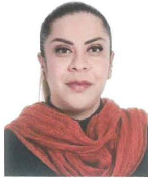
Sen. Eunice Renata Romo Molina

REGISTRO DE LA VOTACIÓN DEL DICTAMEN DE LA TERCERA COMISIÓN CON PUNTO DE ACUERDO POR EL QUE LA COMISIÓN PERMANENTE DEL HONORABLE CONGRESO DE LA UNIÓN EXHORTA RESPECTUOSAMENTE A LA SECRETARÍA DE GOBERNACIÓN, PARA QUE, A TRAVÉS DE LA COMISIÓN NACIONAL PARA PREVENIR Y ERRADICAR LA VIOLENCIA CONTRA LAS MUJERES, CONTINÚE CON LA VIGILANCIA Y MINISTRACIÓN EN TIEMPO Y FORMA DE LOS RECURSOS ETIQUETADOS EN EL PROGRAMA DE APOYO PARA REFUGIOS ESPECIALIZADOS PARA MUJERES VÍCTIMAS DE VIOLENCIA DE GÉNERO, SUS HIJAS E HIJOS, DEL EJERCICIO FISCAL 2022.