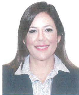
Sen. Gina Andrea Cruz Blackledge

REGISTRO DE LA VOTACIÓN DEL DICTAMEN DE LA TERCERA COMISIÓN CON PUNTO DE ACUERDO POR EL QUE LA COMISIÓN PERMANENTE DEL HONORABLE CONGRESO DE LA UNIÓN EXHORTA RESPETUOSAMENTE A LA SECRETARÍA DE GOBERNACIÓN, PARA QUE, A TRAVÉS DE LA COMISIÓN NACIONAL PARA PREVENIR Y ERRADICAR LA VIOLENCIA CONTRA LAS MUJERES, CONTINÚE CON LA VIGILANCIA Y MINISTRACIÓN EN TIEMPO Y FORMA DE LOS RECURSOS ETIQUETADOS EN EL PROGRAMA DE APOYO PARA REFUGIOS ESPECIALIZADOS PARA MUJERES VÍCTIMAS DE VIOLENCIA DE GÉNERO, SUS HIJAS E HIJOS, DEL EJERCICIO FISCAL 2022.