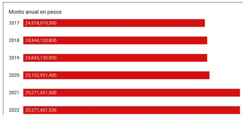
Cuadro 2. Presupuesto anual autorizado a ISSEMyM (datos de la cuenta pública del GE México, 2022) 3

El recorte presupuestal ha generado desabasto de medicamentos. Por ello, derechohabientes incorporados a ese instituto, realizaron diversas manifestaciones el pasado 23 de junio frente la sede del Instituto de Seguridad Social del Estado de México y Municipios para reclamar una mejor atención y el suministro de tratamientos a personas con cáncer, deficiencia renal y otros padecimientos crónicos 4 . Los manifestantes también han expresado que ese desabasto de medicamos se suma a la falta de especialistas para cirugía y que, al no haber médicos en esas áreas, los pacientes tienen desenlaces trágicos 5 .