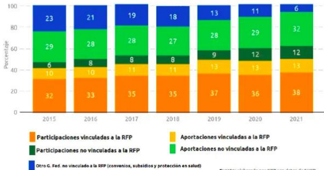
Gasto federalizado vinculado a la RFP 2015 - 2021

RFP. De este porcentaje, el 35% estuvo relacionado directamente a través de cuatro fondos de participaciones y el 11% indirectamente mediante cuatro fondos de aportaciones. El 54% restante del gasto federalizado no estuvo vinculado a la RFP, de los cuales, el 9% fueron participaciones, 29% aportaciones y 16% fueron convenios, subsidios y gasto de protección en salud, como se observa en el siguiente cuadro: