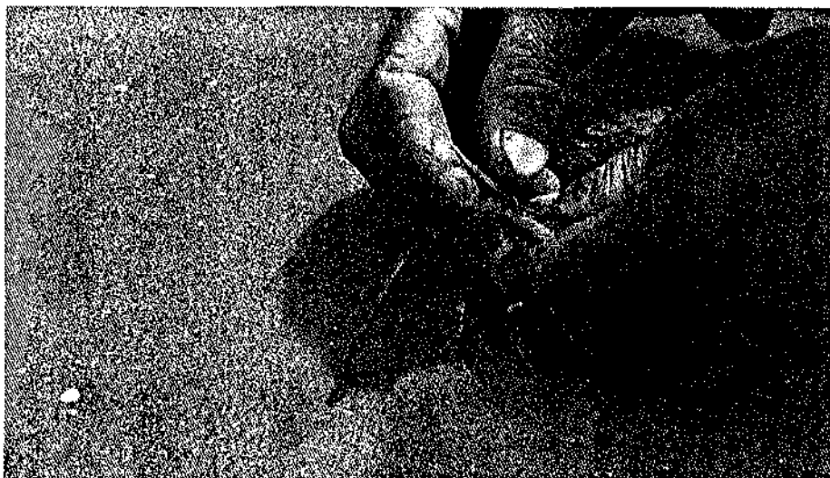
Figura 2. Mutilación de rayas para proteger a turistas en Semana Santa causa indignación en Sonora. 1