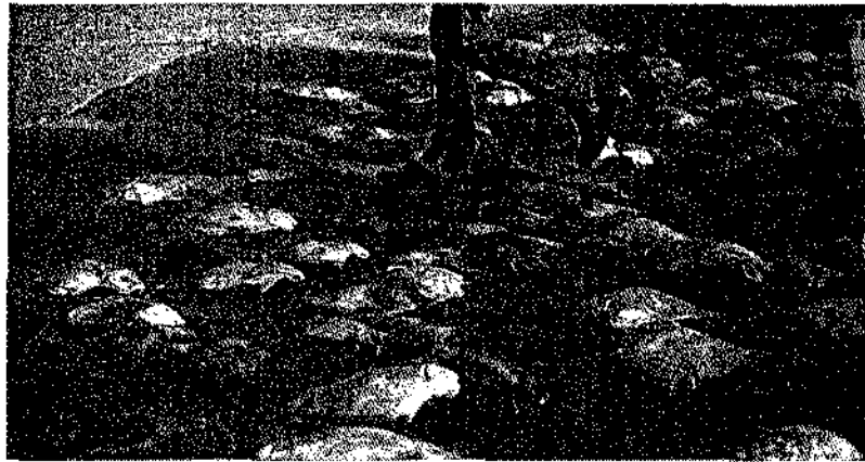
Figura 3. Esto es lo que se sabe de las rayas mutiladas.

De acuerdo a la Ley General del Equilibrio Ecológico y la Protección al Ambiente, algunos de los objetivos que se deben cumplir, son los siguientes: