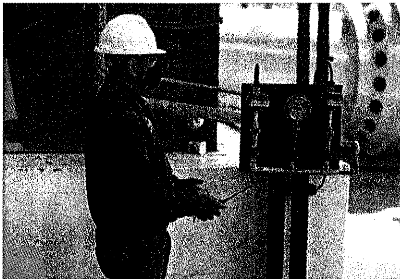
Figura 2. Semamat planea prorrogar por segunda ocasión términos y plazos de Conagua por hackeo.

de la preparación y respuesta ante posibles amenazas. Además, se promueve la transparencia y el acceso público a la información, garantizando que los ciudadanos y las partes interesadas puedan acceder de manera segura a los datos relevantes sobre la gestión del agua.