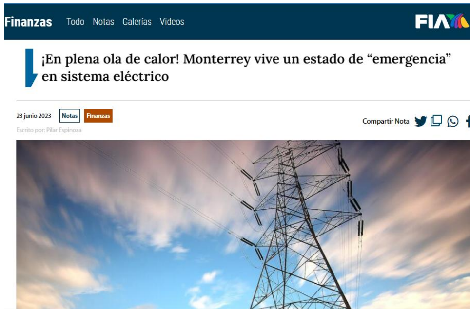
Figura 1. Declaran estado de “emergencia” en sistema eléctrico de la ciudad de Nuevo León. 4

Factores como la presente sequía, la ausencia de precipitaciones y la presencia de otros eventos meteorológicos como las olas de calor, resulta fundamentales en el incremento de demanda de energía por parte de los usuarios, más en las entidades donde cobran mayor impacto los eventos referidos.