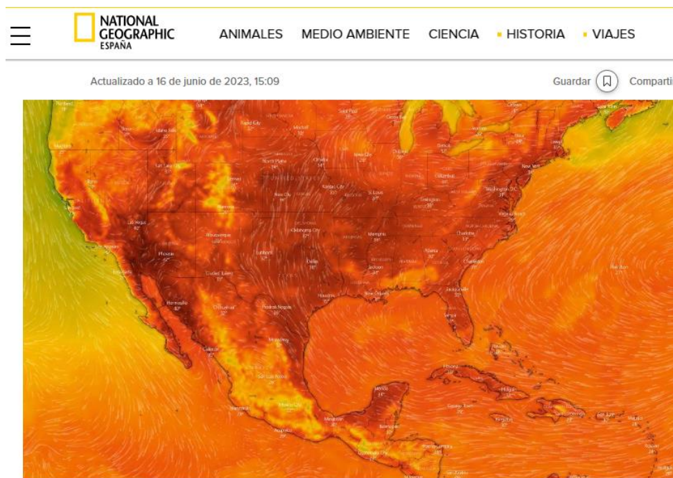
Figura 2. Mapa de Centroamérica, México en el servicio web del clima eólico

De acuerdo a diversas publicaciones realizadas por los medios masivos, en nuestro país hemos experimentado recientemente una ola de calor denominada técnicamente como un domo de calor, ello, es un factor primordial para que se disparara la demanda en el consumo de energía, principalmente en las regiones donde el fenómeno presenta mayor impacto.