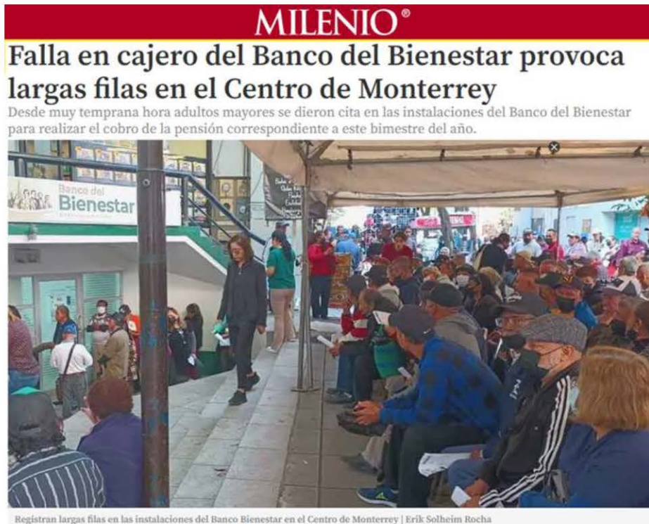
Registan largas filas en las instalaciones del Banco Bienestar en el Centro de Monterrey

"2023, Año de Francisco Villa, el revolucionario del pueblo"