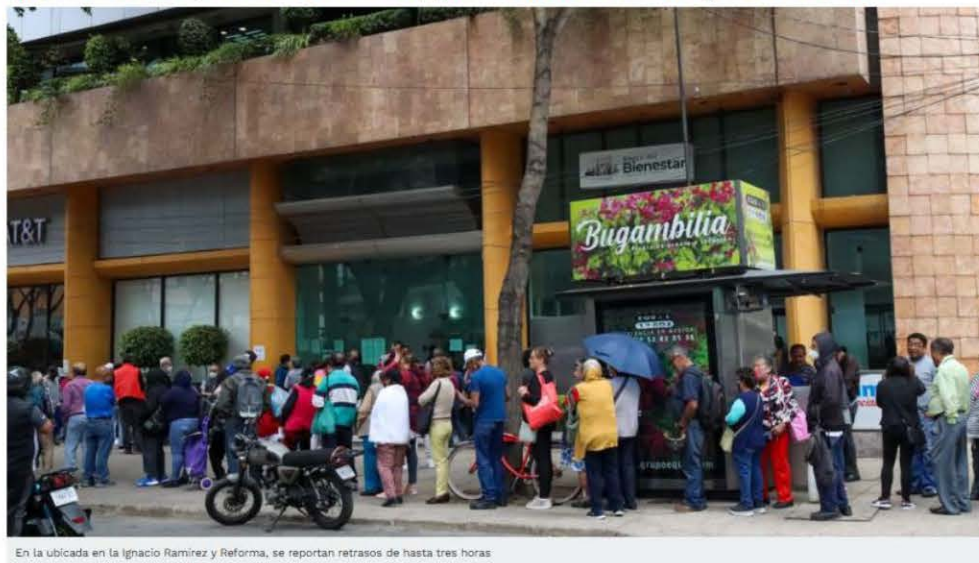
En la ubicada en la Ignacio Ramírez y Reforma, se reportan retrasos de hasta tres horas

En la sucursal de Ignacio Ramírez, esquina con avenida Reforma, varios adultos mayores informaron que, ante la espera, ha habido discusiones, gritos en insultos a los trabajadores del banco