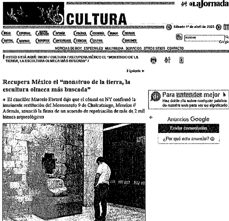
Figura 3. México recupera el monstruo de la tierra. 3

De acuerdo a la acción antes descrita y de acuerdo al precedente más reciente con la recuperación, en adelante debemos recuperar las piezas culturales más importantes de nuestro país; tal y como se expone en la nota, quien tenga piezas de tal naturaleza, deberá acreditar el medio por el cual demuestre la propiedad, en el caso contrario, desde esta soberanía, estamos unidos en una voz para apoyar a las autoridades de este gobierno para que puedan recuperar piezas como la del monstruo de la tierra y la máscara de Tezcatlipoca entre otras.