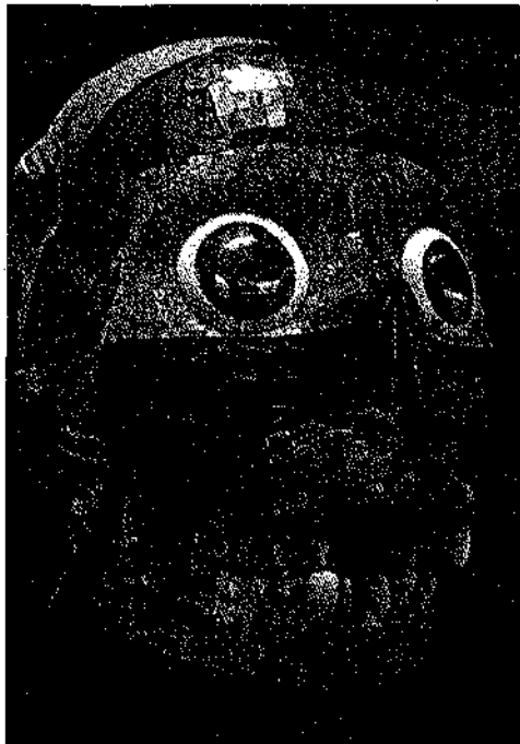
Figura 1. Mascara de Tezcatlipoca. 1

La máscara de Tezcatlipoca se utilizaba en ceremonias y rituales religiosos. Era un objeto sagrado que se asociaba con el poder divino y se consideraba un medio para comunicarse con el mundo espiritual. La máscara representaba el rostro de Tezcatlipoca y solía tener características distintivas, como una boca abierta, una lengua de serpiente y dientes afilados. A menudo estaba adornada con plumas, piedras preciosas y elementos simbólicos relacionados con la deidad.