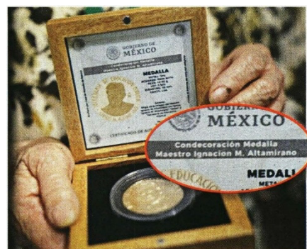
AMLO entregó la presea al mérito educativo, en la que, por error, se consignó "Ignacion" en vez de Ignacio M. Altamirano.